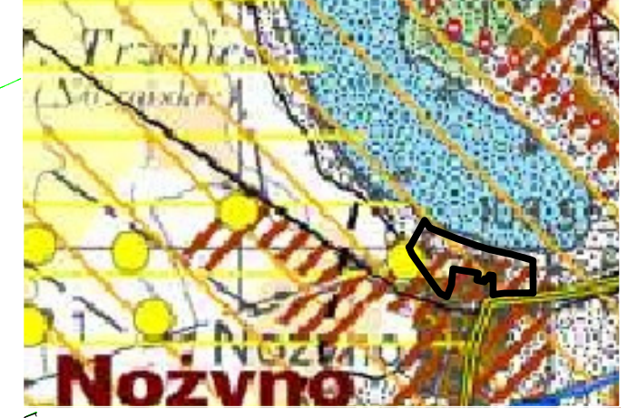
granica opracowania planu miejscowego - ark B