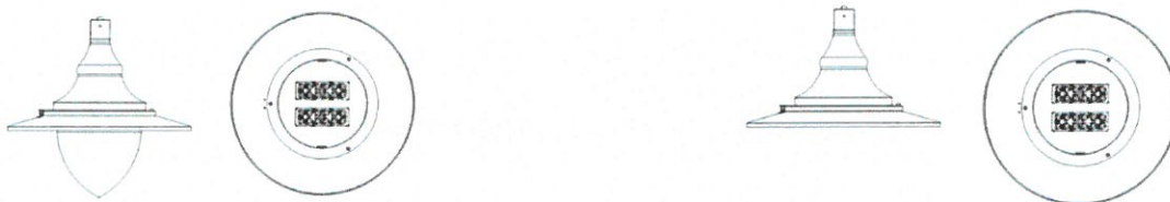
Rys. 1. Przykładowy wygląd oprawy