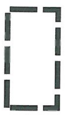
GRANICA OPRACOWANIA ZMIANY MIEJSCOWEGO PLANU ZAGOSPODAROWANIA PRZESTRZENNEGO